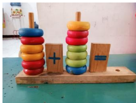
Gambar 1. Alat Permainan Edukatif Siswa Autis