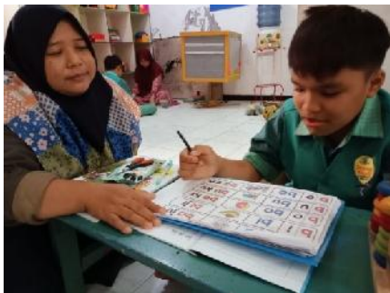
Gambar 3. Pembelajaran siswa autis

ulang. Seseekali memberikan reward untuk dia agar tidak bosan mengikuti instruksi yang kita berikan. Dengan usaha yang saya lakukan, saat ini siswa autisme yang saya dampingi, sudah lancar membaca, dan mampu berkomunikasi dengan baik, walaupun belum semaksimal siswa reguler lainnya”