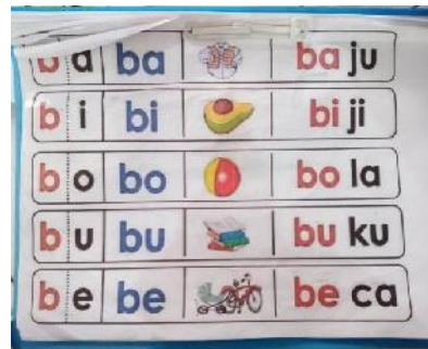
Gambar 4. Media Membaca

Berdasarkan hasil penelitian di atas, dapat disimpulkan bahwa pengembangan kecerdasan verbal-linguistik pada siswa autis di SD Muhammadiyah 16 Surabaya dilakukan melalui berbagai strategi pembelajaran yang terintegrasi. Guru memberikan stimulus bahasa melalui gerakan tubuh, manipulasi benda konkret, serta pengulangan kata-kata secara berkelanjutan yang disertai pendampingan bertahap dan penuh kesabaran untuk menciptakan suasana belajar yang nyaman. Selain itu, metode bercerita dimanfaatkan sebagai sarana untuk mengoptimalkan daya imajinasi siswa autis yang cenderung tinggi, sehingga kemampuan berbahasa dapat berkembang secara lebih alami dan komunikatif.